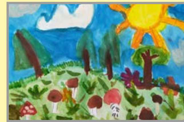
Грибная пора Рис. Андрея Глушаева, 8 л.