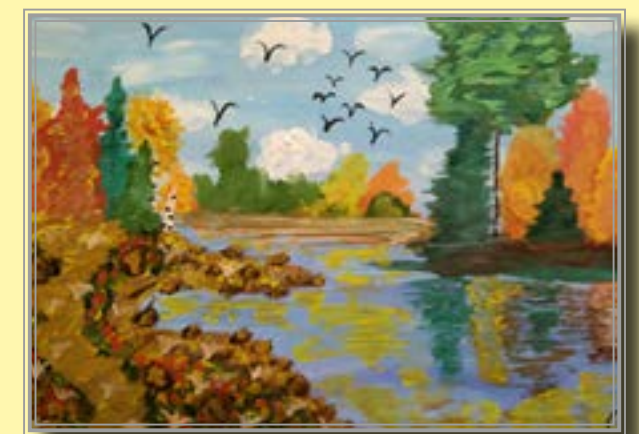
Птицы на юг улетают... Рис. Софья Головиной, 11 л.,