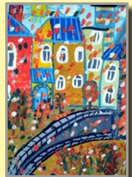
Осень пришла в город Рис. Ростислава Сиялова, 10 л.