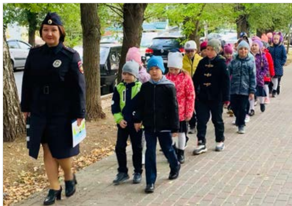
Первоклассники вместе с инспектором свайвают безопасный маршрут

Приходи, мы ждём тебя! Не упусти свой шанс!