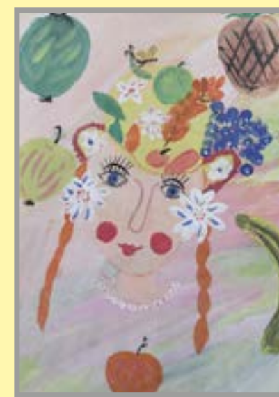
Фруктовая принцесса Рис. Глеба Завьялова, 10 л.