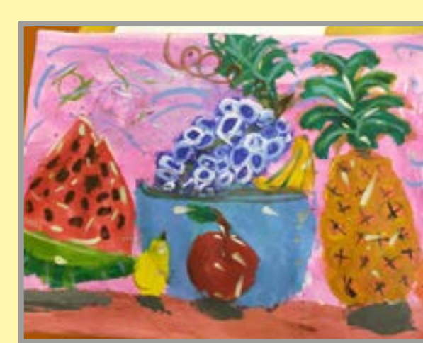
Вкусное угощение осени Рис. Матвея Головинкина, 8 л.