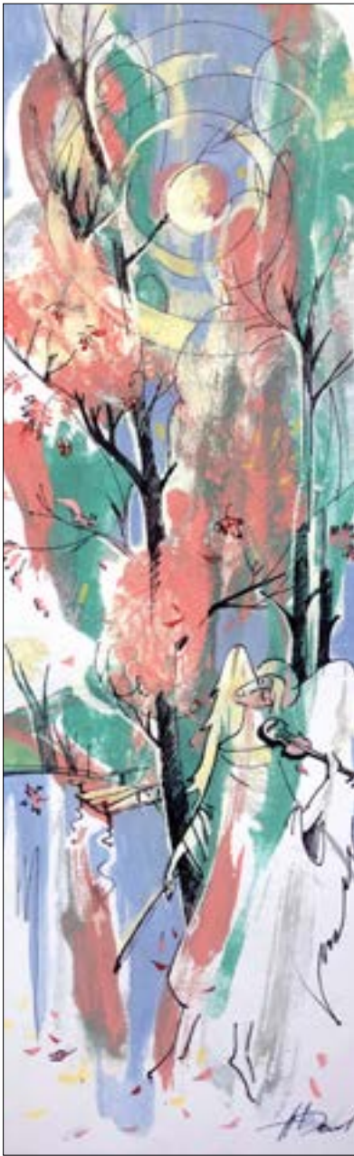
Закладка. Автор А. Демьянов