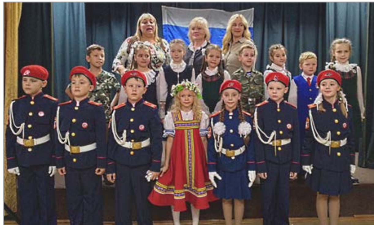
Самые младшие вокалисты конкурса «Тебе поём, Россия!»

Какие же песни выбрали выступающие, чтобы исполнить их со сцены во славу Отечества? Немало песен прозвучало времен Великой Отечественной войны, и песен о мире. О красоте родной природы – о широте полей, шелесте берёз, о прохладе его больших и малых рек и озер... Песни о веселом и счастливом детстве, о дружбе детей разных народов, живущих в России, о семье, ладной да складной – эти песни здесь тоже пелись. О родном доме, родном дворе, и звонкой гармонии, которая веселит душу – это тоже песни о родине. И о величественных храмах с золотыми купола-