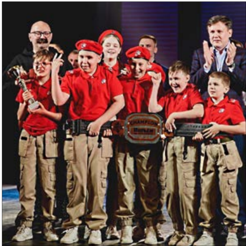
Команда КВН «Юрец»

Кроме выступлений на сцене, КВН – это ещё и встречи, и общение с известными людьми и КВН-щиками, которые приезжают к нам либо гостями, либо членами жюри. Например, на Лиге силовых структур гостями КВНа была команда «Борцы» из г. Сургута. Они играли в Высшей лиге КВН и раньше я их видел только