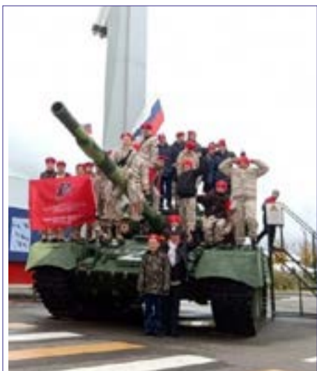
Юнармейцы на выставке военной техники в Москве См. на стр. 2

Лучшие представители Юнармии побывали в столице и посетили известные мемориальные места.