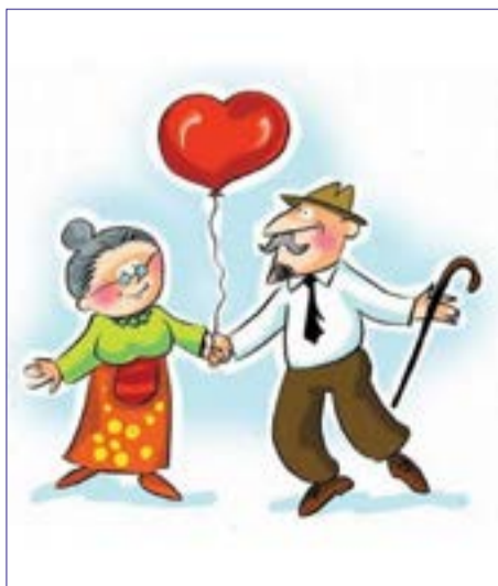
См. на стр. 6 - 7

Как школьники поздравили и что пожелали старшему поколению в этот день.