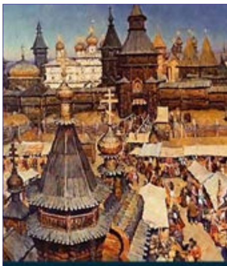
Попов Ю.В. Город Хлынов, торг на площади См. на стр. 4

Какие события происходили на Вятке в те далёкие времена? Как Вятка участвовала в народно-освободительном движении?