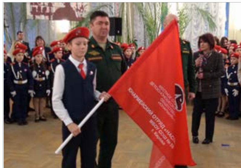
Вручение отрядного знамени МБОУ СОШ № 56