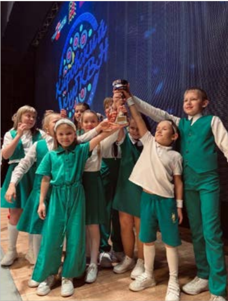
Команда «Разные» МБОУ СОШ № 56

Сегодня Международный день КВН – это праздник и для кировских школьников, которые играют в КВН.