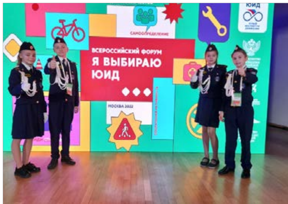
Ребята из школы № 70 на Форуме «Я выбираю ЮИД»

Приходи, мы ждём тебя! Не упusti свой шанс!