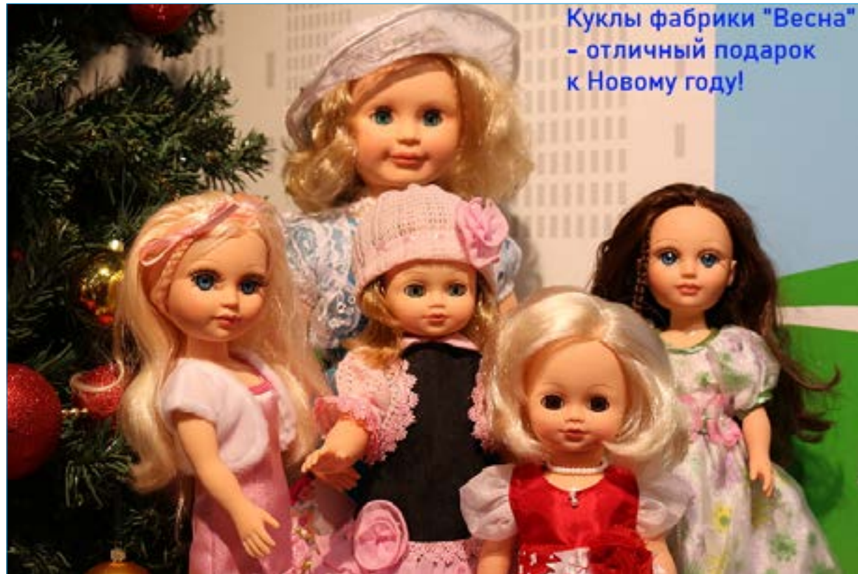
Куклы фабрики "Весна" - отличный подарок к Новому году!