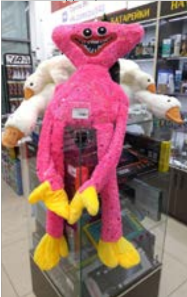
Игрушка Хаги - Ваги