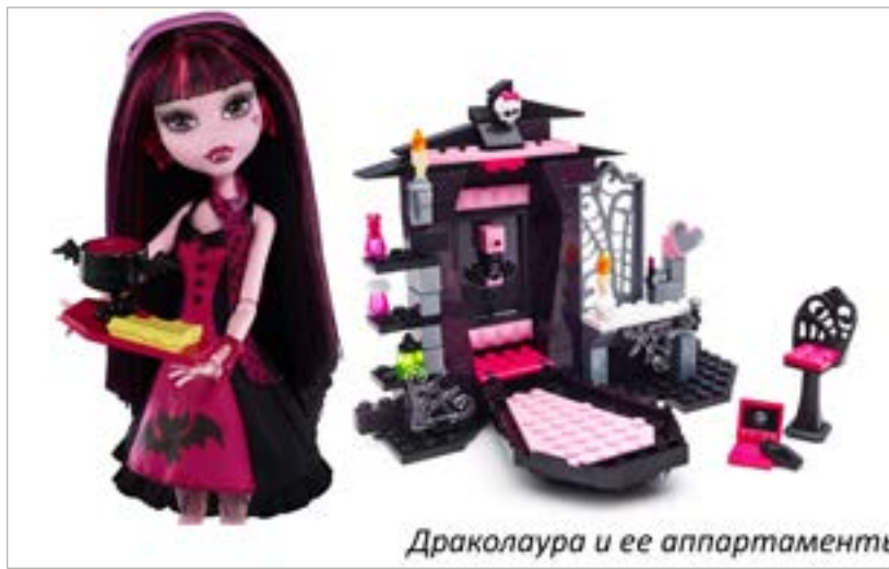
Драколаура и её апартаменты