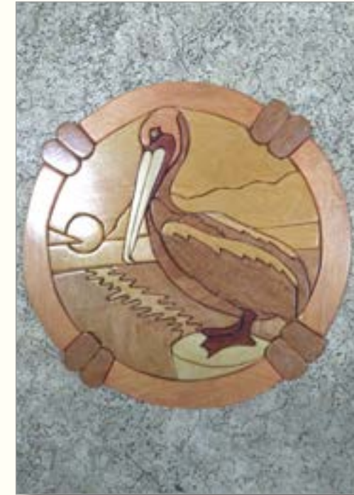
«Пеликан», Антон Исупов, 9 кл., МКО СОШ с. Филиппово, Кирово-Чепецкого р-на преподаватель: А. В. Саитов