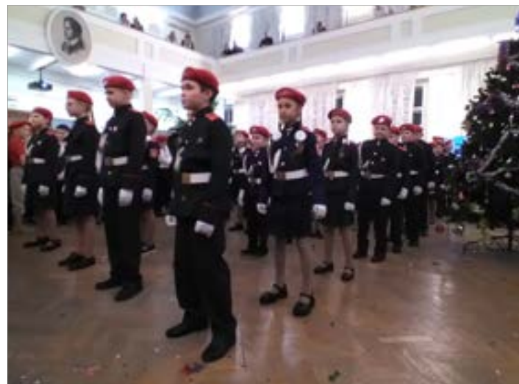
Танцует отряд «Бастиион», МБОУ СОШ №25