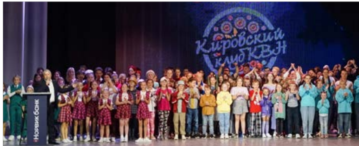
Президент начинает КВН!