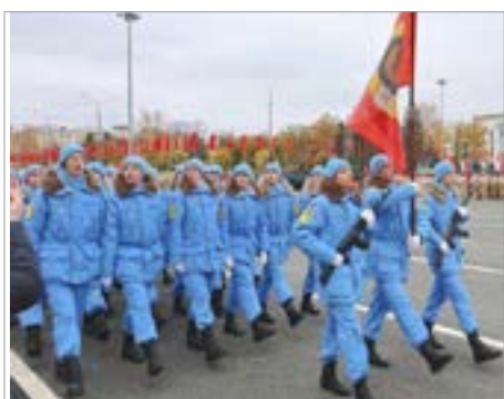
Кировские юнармейцы шагают в парадном расчёте

Репортаж об участии юнармейских отрядов в XII Параде в г. Самаре, который прошёл под названием «Дорога Победы»