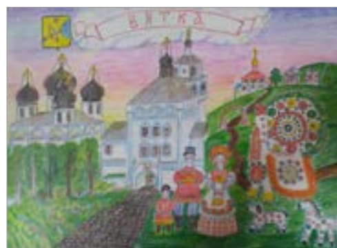
«Вятские матрешки» Работа с выставки конкурса «Мы гордимся!»

О самых ярких и интересных событиях уходящего года Культурного наследия