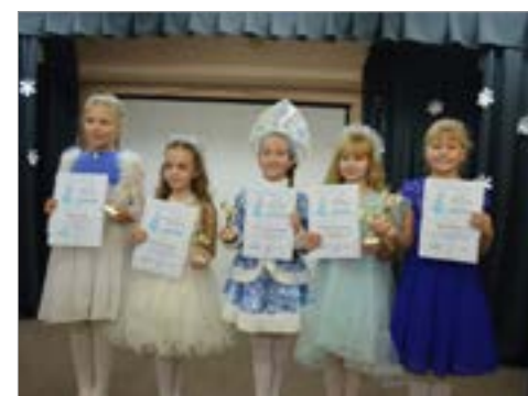
Победительницы - Снежинки второй возрастной группы 9 - 12 лет

Конкурс, в котором соревнуются самые обаятельные и талантливые и Снежинки нашего города