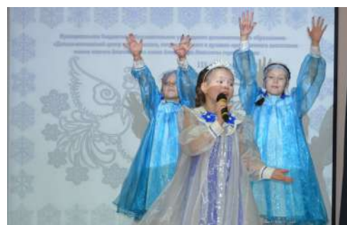
«Вятская Снежинка — 2024». - С. 8