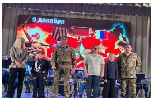
День Героев Отечества. - С. 2