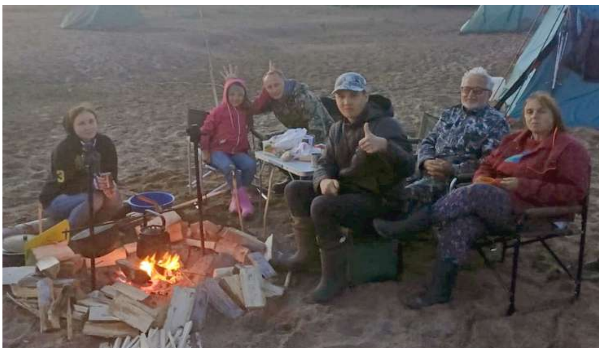
«Семейный отдых у реки» Екатерина Здоренко