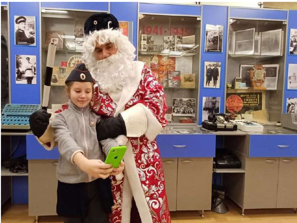
Селфи с Полицейским Дедом Морозом