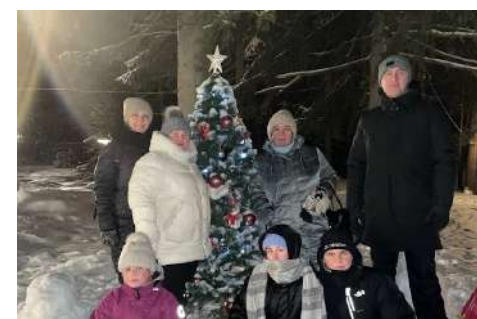
Семья моя любимая! - С.10-11.