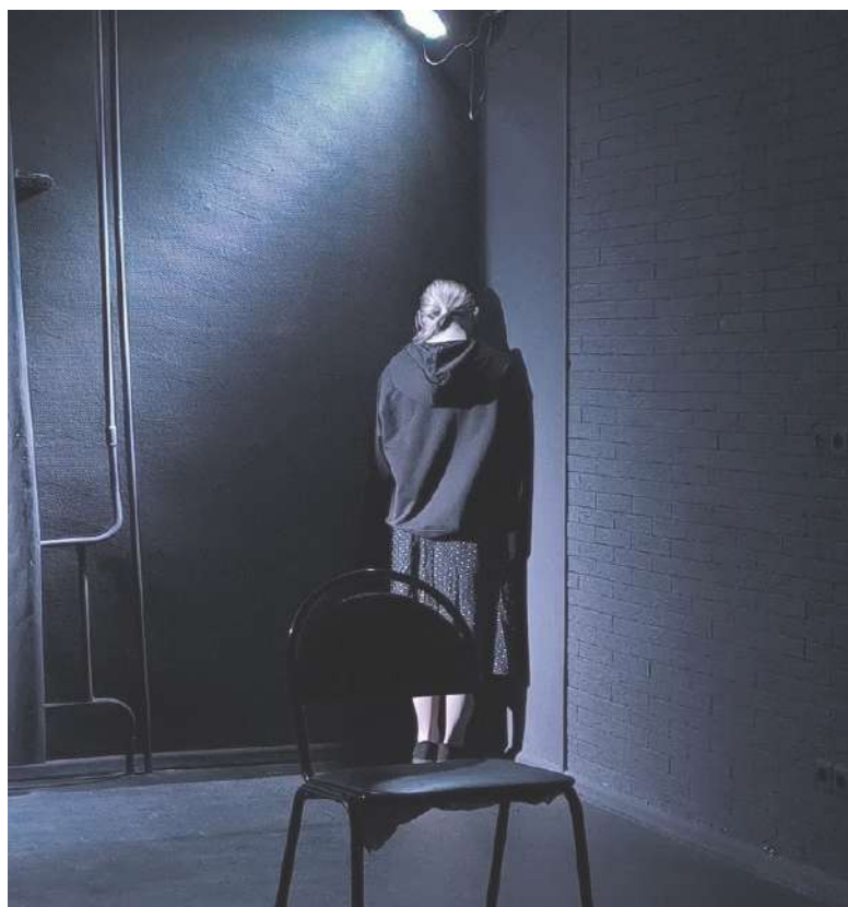
Сцена из постановки пьесы «Клочок»