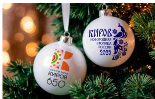
Киров — Новогодняя столица! - С. 4