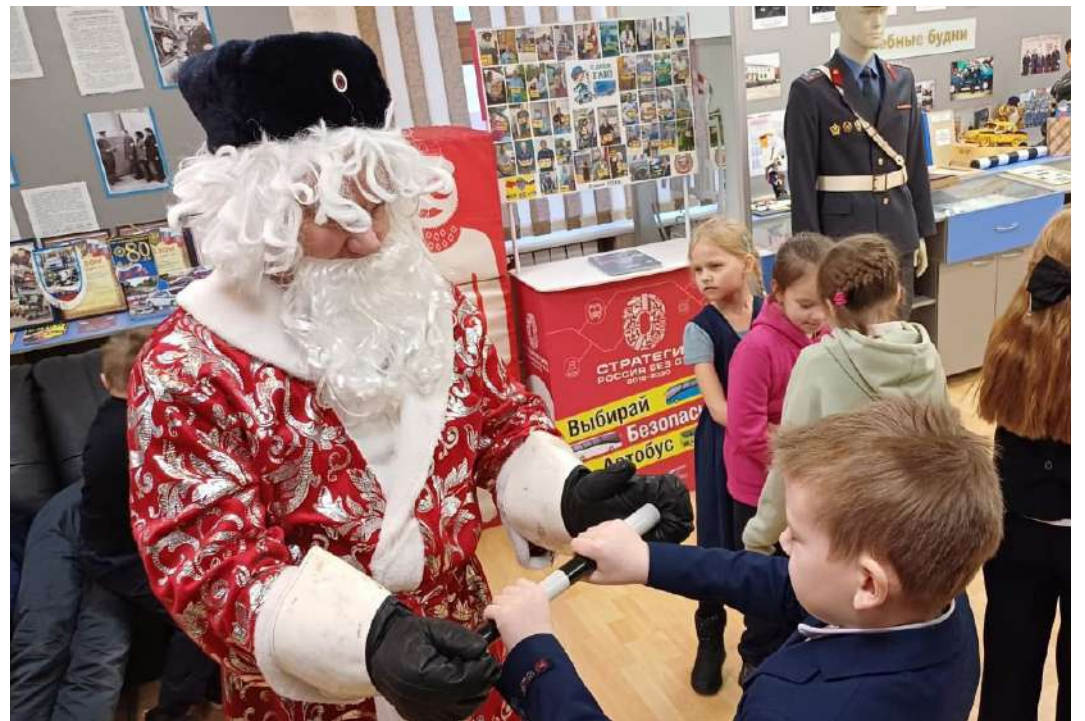
Волшебный посох Полицейского Деда Мороза