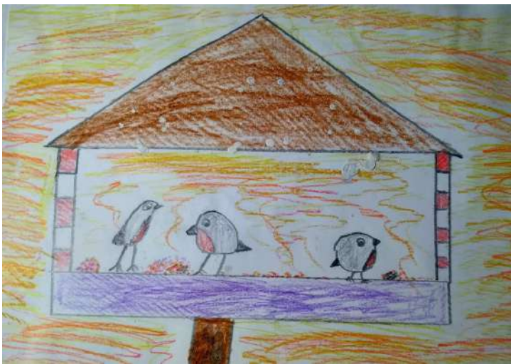
«Комбинат птичьего питания» Артемий Яндубаев