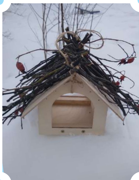
Бажена Шихарёва 6 «Б» кл., шк. № 51