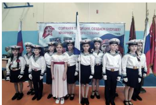
Парад исторических войск. — С. 2