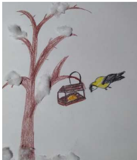
«Долгожданный обед» Миррон Шустов