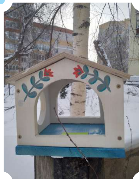
Ирина Лучник д/с № 114