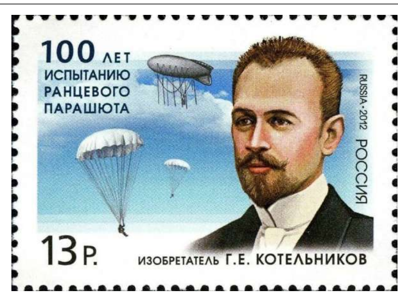
Почтовая марка в честь изобретателя парашюта Г. Котельникова

В 1921 году он получил патент в России, а значительно раньше, в 1912 г. — во Франции, Германии и в США. 6 июня 1912 года со-