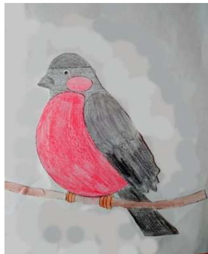
«Гость с севера»