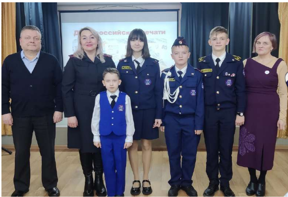
Победители викторины о Дне российской печати вместе с журналистами газеты

Журналисты рассказали гостям много интересного о газете «Мы вместе», а также познакомили ребят с историей отечественных, в том числе детских средств массовой информации. Затем ребята из ЮИД приняли участие в тематической викторине, посвящённой Дню