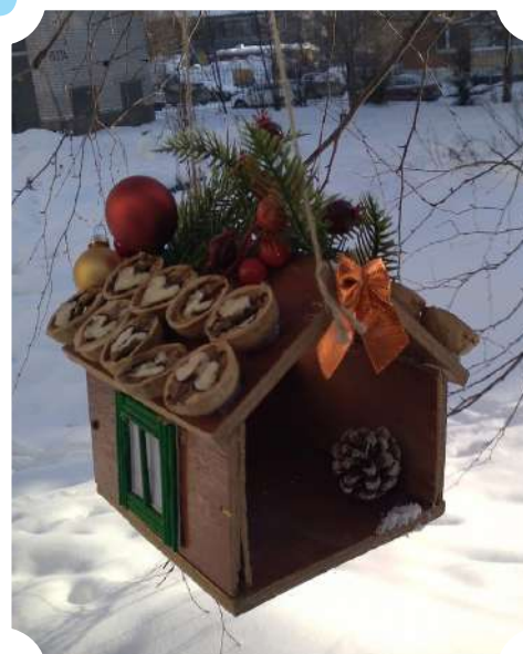
Даниил Гладенко, д/с № 114