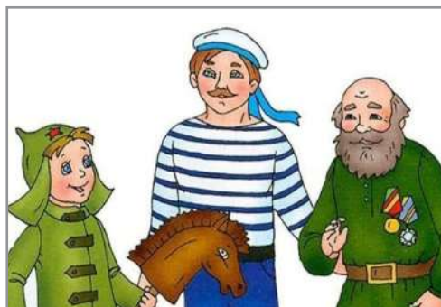
Год Защитника Отечества. — С. 6 - 7