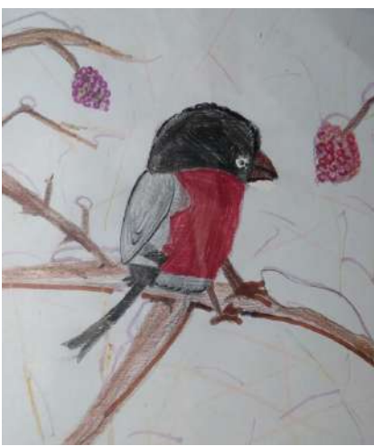
«Одинокий снегирь» Дарья Мелехова