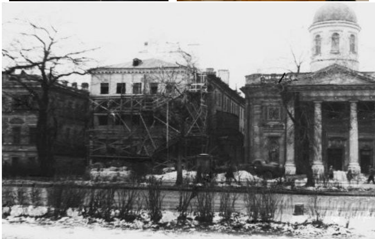
Снятие лесов после блокады со зданий. Крайнее слева - здание церкви Св. Екатерины