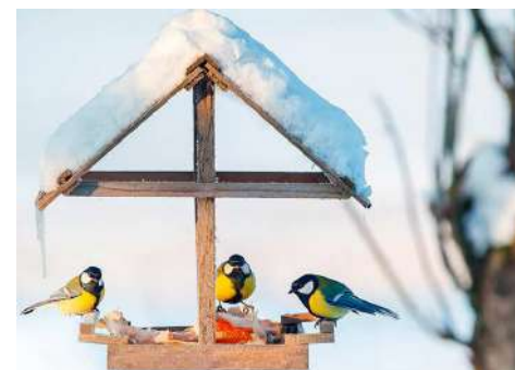
Пичужкам - кормушки! — С. 12 - 13