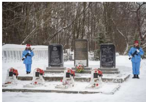
Память о блокаде Ленинграда. — С. 3